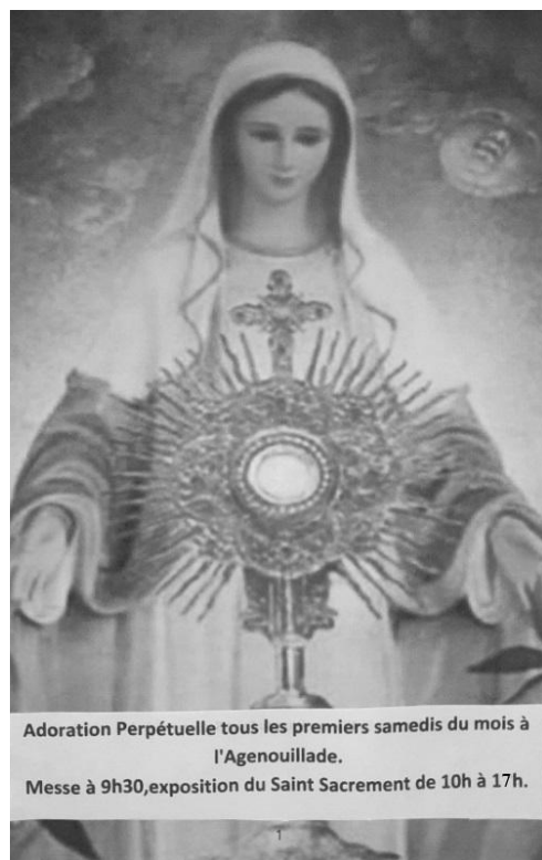
Adoration Perpétuelle tous les premiers samedis du mois à l'Agenouillade. Messe à 9h30, exposition du Saint Sacrement de 10h à 17h.